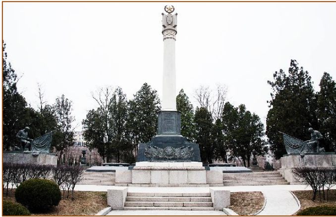
Монумент, установленный в честь советских воинов освободителей, 1955

История появления русского кладбища в Порт-Артуре – это тема отдельная, когда-нибудь я расскажу об этом. В данном случае стоит начать с 1955 года, когда советские войска покинули военноморскую базу в Порт-Артуре. В знак благодарности советским воинам китайцы поставили на русском кладбище монумент. С уходом русских (а для китайцев – иностранцев) стало не актуально