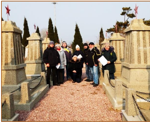
Рабочая группа поисковиков 5 января 2019 г.

кладбище стояли китайские дети с ведрами, водой и лопатами, готовые к высадке деревьев для аллеи дружбы.